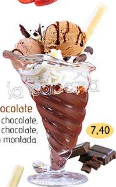
Capricho de chocolate

Crema de chocolate, helados de café y chocolate, con nata montada.